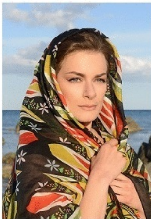
Pareo Joias Mod. dep.