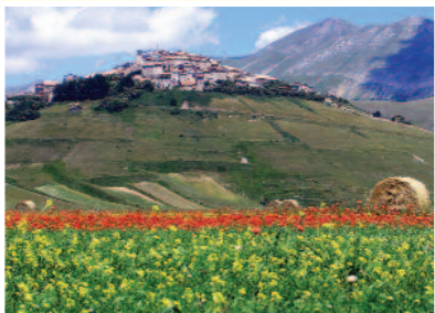
Castelluccio di Norcia