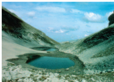
Lago di Pilato - Parco Nazionale dei Monti Sibillini