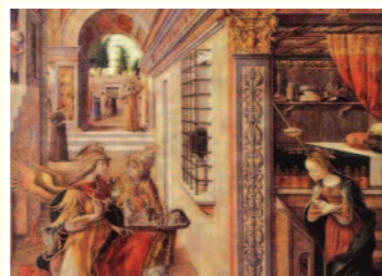
Carlo Crivelli - Annunciazione