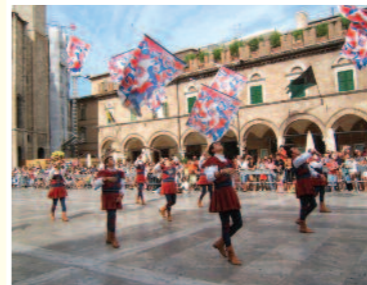
Ascoli Piceno - Quintana