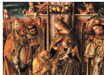
Carlo Crivelli - Vergine col Bambino