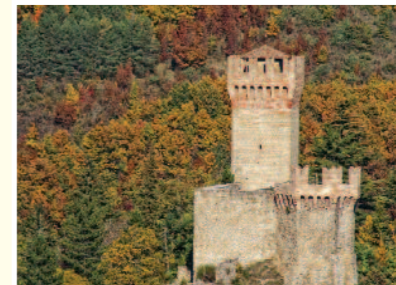
Arquata del Tronto