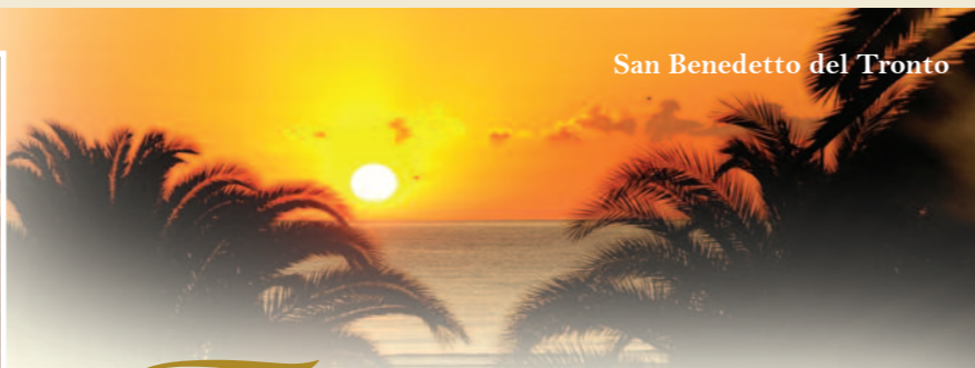
San Benedetto del Tronto