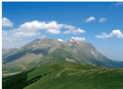
Monte Vettore - Parco Nazionale dei Monti Sibillini