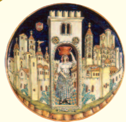
Museo dell'Arte della Ceramica Ascoli Piceno