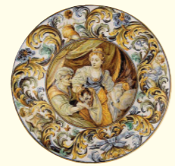
Ceramica di Castelli