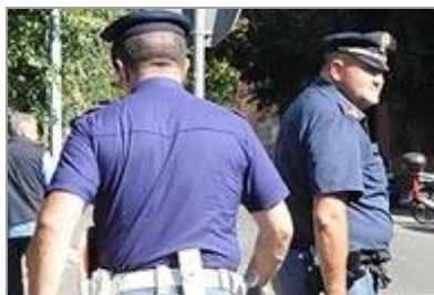
Poliziotti durante un controllo

Il sindacato: pochi ispettori per controllare. Sotto inchiesta sette agenti delle Volanti, uno dell'ufficio immigrazione e tre militari dell'esercito