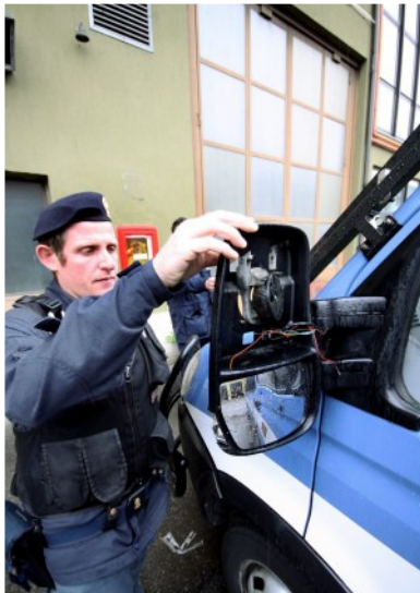
Un mezzo della polizia danneggiato durante il blitz