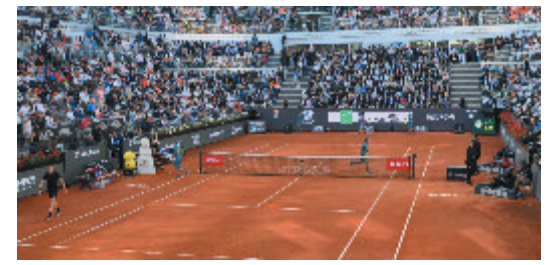
Il campo centrale del Foro Italico

racchette, più palline, seguono più tennis in tv e riempiono alberghi e ristoranti durante i grandi eventi. E in quattro anni i tesserati di tennis e padel sono aumentati del 266%, trasformandosi in un fenomeno sociale oltre che sportivo. Nel frattempo il calcio italiano continua a inseguire: stadi vecchi e nuove polemiche. Per questo il voto del 22 giugno non sarà soltanto una scelta federale. Sarà una vera e propria sfida: continuare a vivere di rendita sul proprio passato oppure trovare finalmente il coraggio di cambiare e risorgere dalle proprie ceneri.