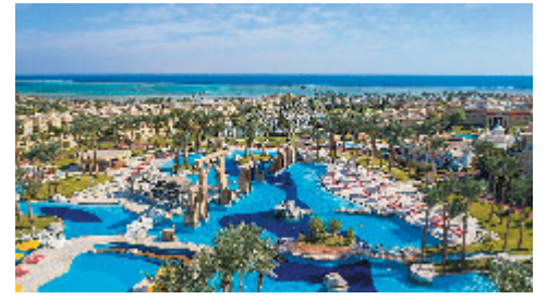
Un resort nella località egiziana

inizialmente trasferiti all'Ircs materno infantile per accertamenti sulle loro condizioni di salute, per poi essere collocati in una comunità adeguata. La Procura per i minorenni è stata informata e i genitori, nel frattempo, sono stati avvisati della decisione, con possibilità di incontrare i figli nella struttura. Avviato anche un percorso di supporto alla genitorialità per favorire il ricongiungimento familiare.