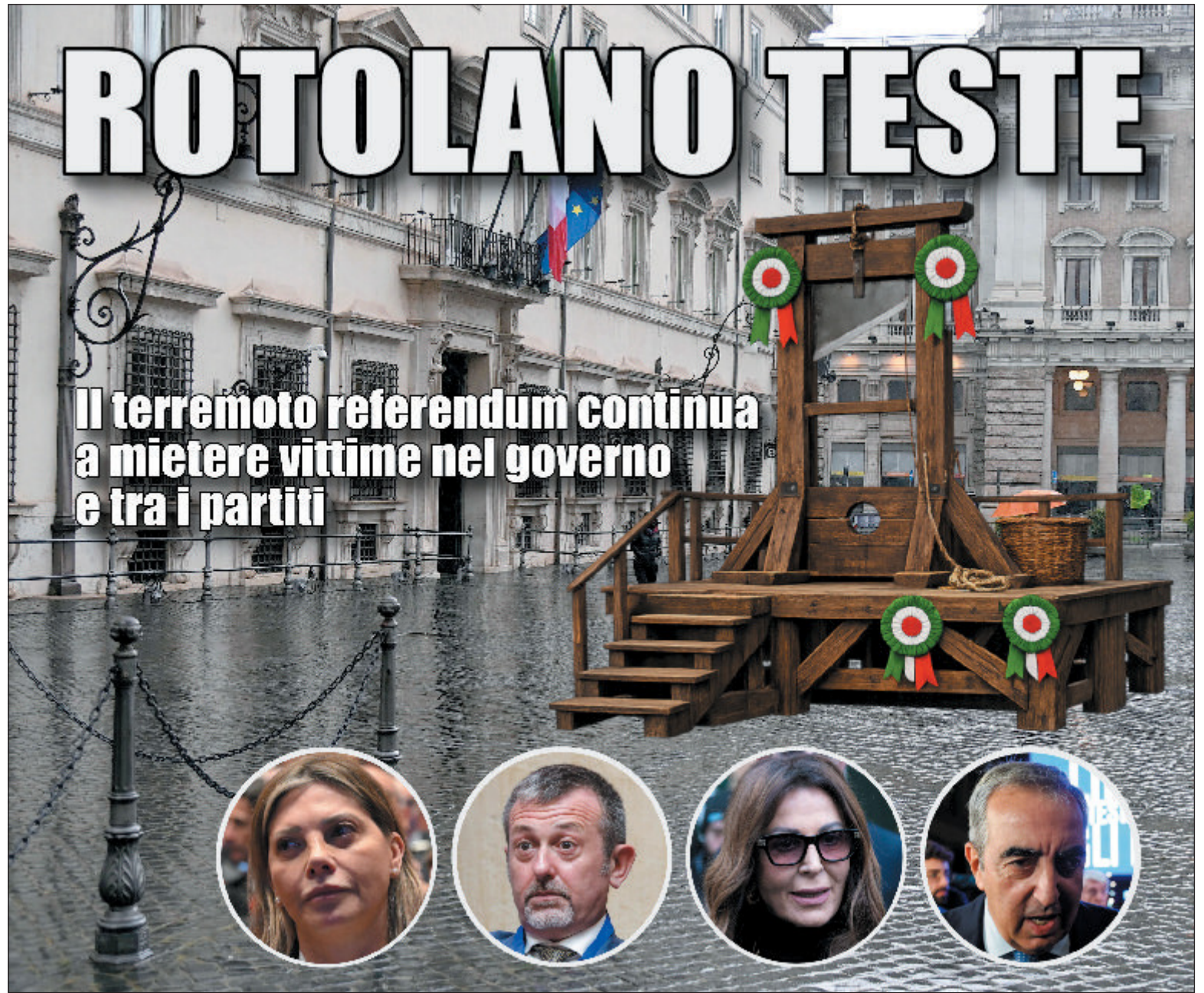
Montaggio di GIANLUCA PASCUTTI