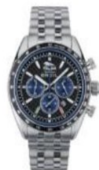
POLICE CHRONO 43 MM

Compariranno i due modelli di orologio e cliccando sul prodotto scelto verrete direttamente indirizzati alla scheda prodotto.