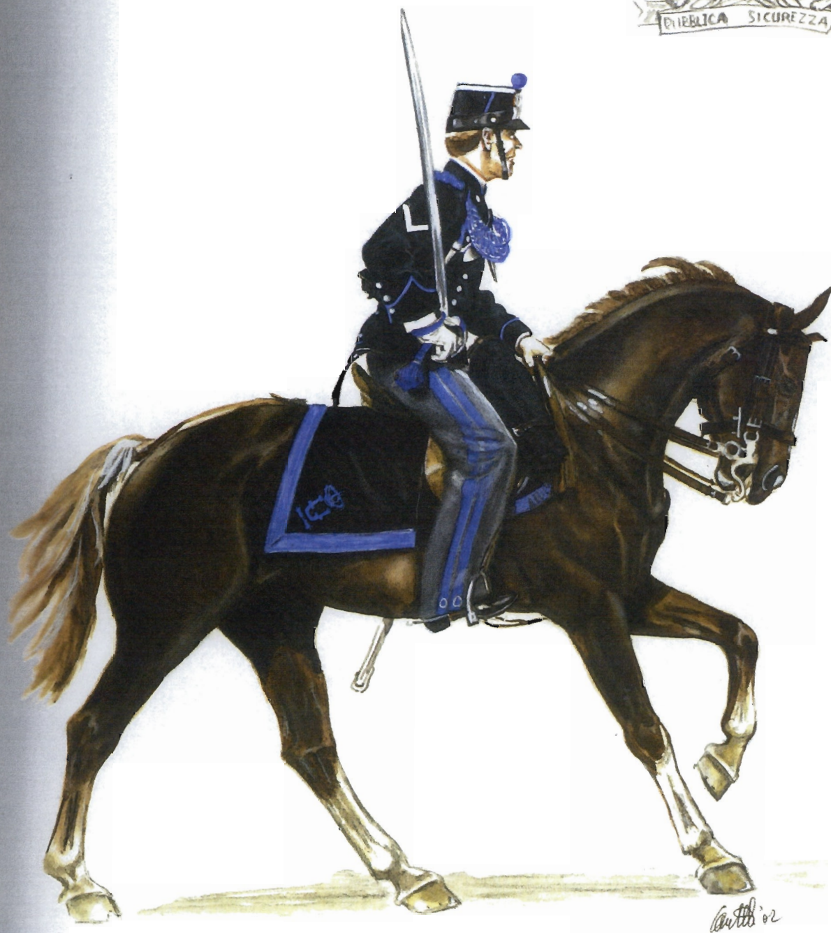
Appuntato in tenuta festiva e di parata – 1883