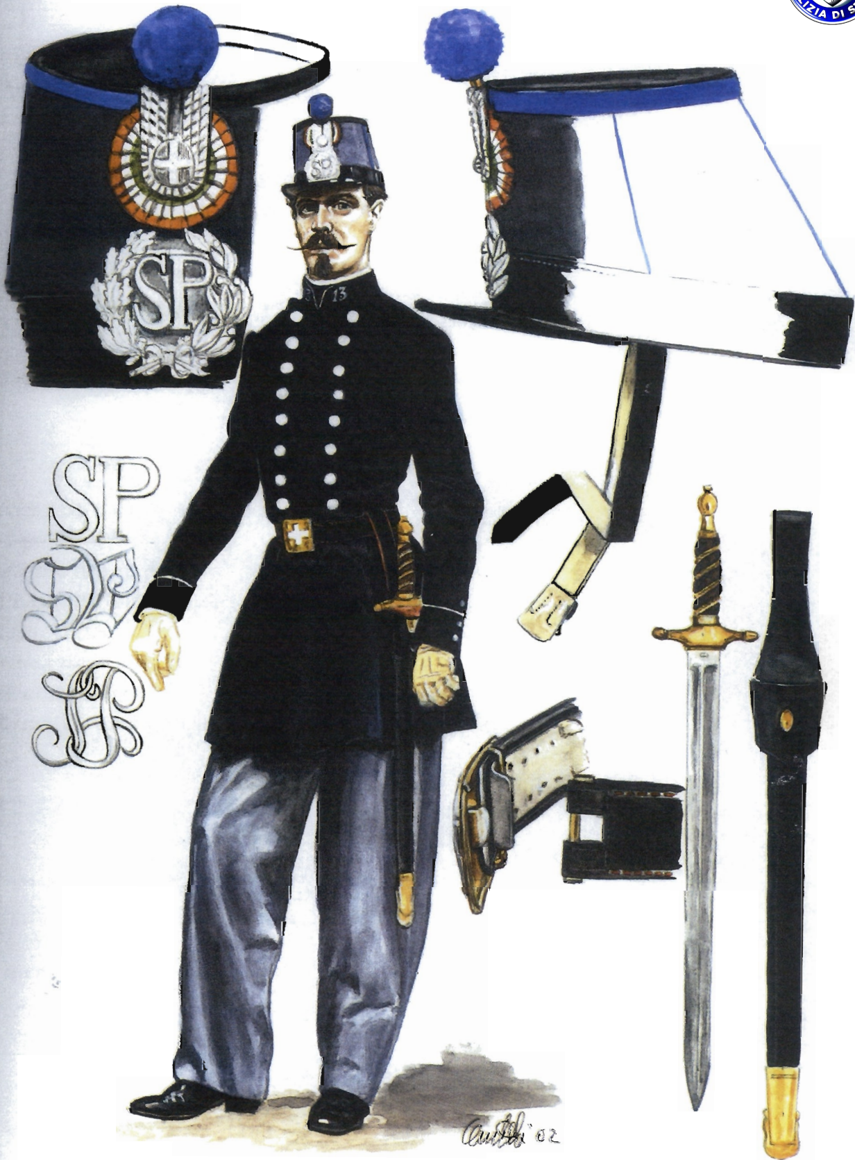
Guardia in tenuta ordinaria - 1852