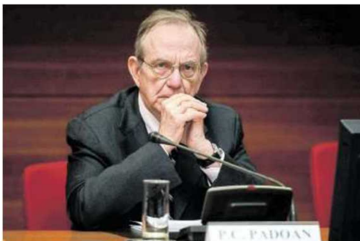
Il ministro dell'Economia, Padoan