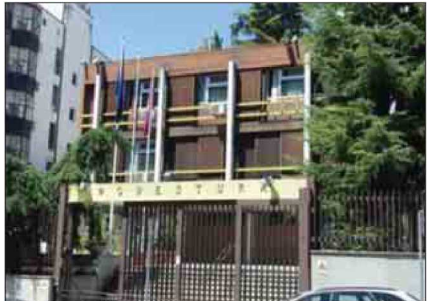
La Questura di Potenza; ieri la visita del capo della Polizia Gabrielli