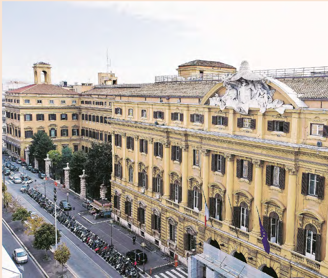
Il Ministero dell'Economia e delle Finanze, Roma