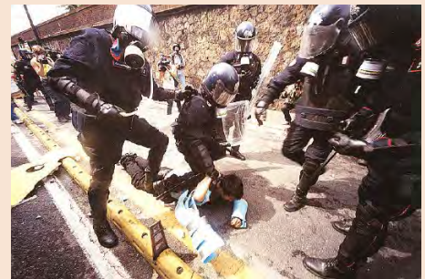
GENOVA Gli scontri tra polizia e manifestanti al G8 del 2001