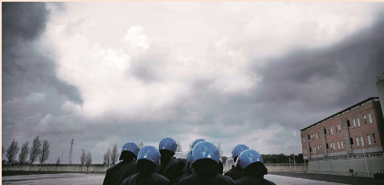
MARTA SARLO / CONTRASTO