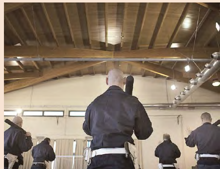
MARTA SARLO / CONTRASTO