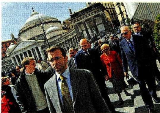
Con Napolitano Pansa con il presidente Giorgio Napolitano e la moglie Clio a Napoli nel 2009